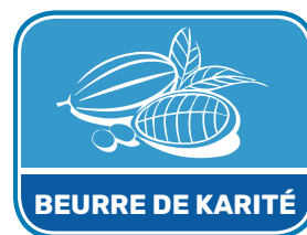
BEURRE DE KARITÉ